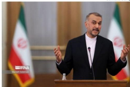
Хосейн Амир Абдоллавиан.

Суннитский шариат казнит. У суннит нет аятолл. Сунниты называют своих юристов улемами. При этом улемы никак не сотрудничают с классическими юристами.